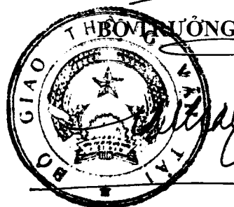
Đinh La Thăng