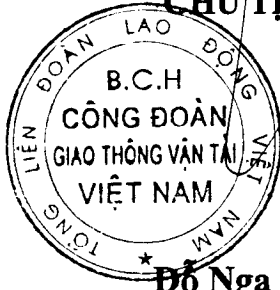
Đỗ Nga Việt